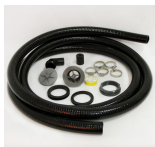
Durchführungsset für ein Kunststofffass